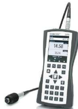
導電率測定器 SIGMATEST 2.070

フェルスター社の渦電流式導電率測定器 SIGMATEST 2.070 であれば、小型・軽量のポータブルタイプであり、誰でも簡便に測定が行えて測定者の技能に結果が依存しません。プローブを被検査材に当てるだけで測定値が表示され、ロギングも行えます。温度補償機能もあり非常に信頼性の高い測定器です。