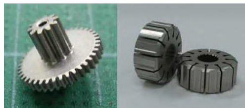
図2：焼結冶金の部品例

そのコイルに部品を通過させると渦電流が誘導され、異材混入、焼結、熱処理の異常などで所定の品質が得られていない場合は渦電流が変化し、その変化が2次側コイルで受信され、不合格と判定され、非接触、非破壊で全数を高い処理速度で検査する事が可能になります。