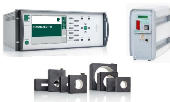
図3：MAGNATEST D、ECM とテストコイル

そのコイルに部品を通過させると渦電流が誘導され、異材混入、焼結、熱処理の異常などで所定の品質が得られていない場合は渦電流が変化し、その変化が2次側コイルで受信され、不合格と判定され、非接触、非破壊で全数を高い処理速度で検査する事が可能になります。